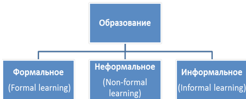
Рис 1. Виды образования

Эти процедуры признания результатов обучения и оценок реализуются через нормативные документы МОН РК и внутренние Положения вузов. У нас практически не возникает вопросов при перезачете кредитов и оценок, когда мы имеем возможность сравнить содержание учебных программ и результатов обучения. В спорных случаях вуз может провести дополнительные контрольные мероприятия.