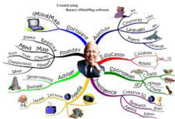
Рис. 1. Образец Карты ума

шенствования - развития памяти, мышления, выдвигает следующие критерии для ее создания: