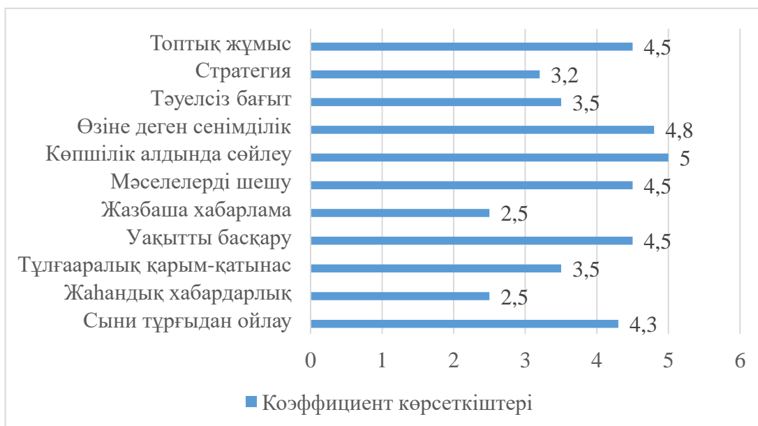
Диаграмма 1. Студенттердің өзін-өзі бағалау арқылы эксперименттерге дейін және одан кейін студенттердің өзін-өзі оқыту қабілетін дамытудың орташа мәндерін салыстыру

Кестеге сай, педагогикалық қызмет міндетті түрде команданың және жеке тұлғалардың алған жұмыс дағдыларын бағалау үшін кері байланысты қамтиды.