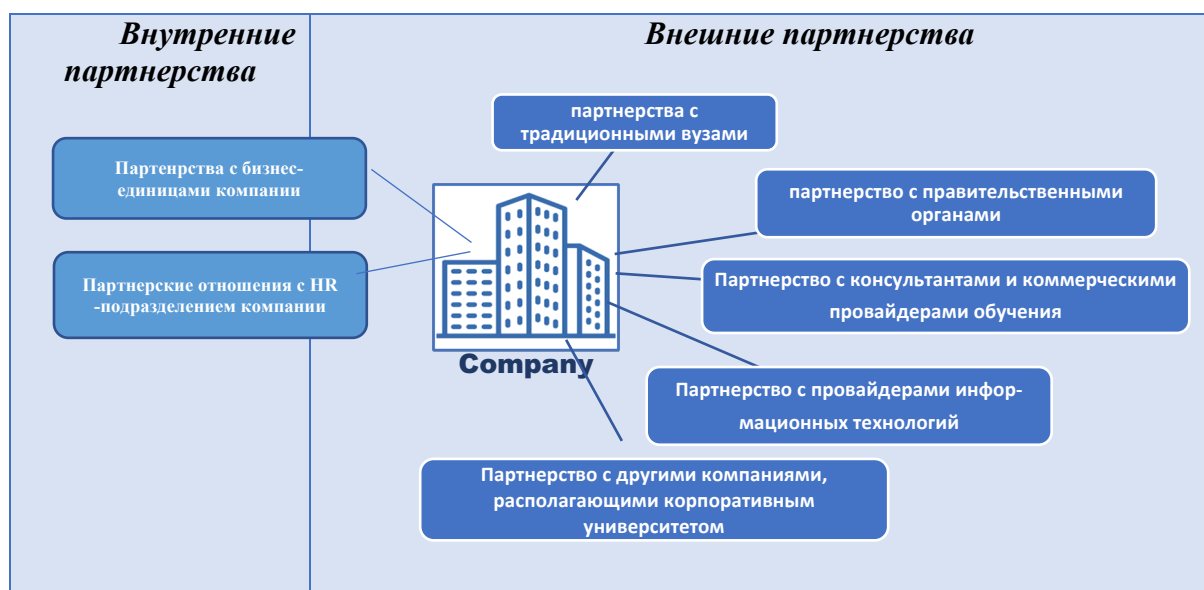
Рисунок 1. Партнерский вид деятельности корпоративного университета

В ходе образовательного процесса в корпоративных университетах активно используется практика привлечения сотрудников различных уровней к совместной разработке образовательных программ. Стоит подчеркнуть, что эти методы оказываются весьма успешными, так как основаны на реальном практическом опыте.